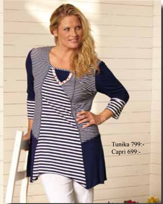
Tunika 799:- Capri 699:-