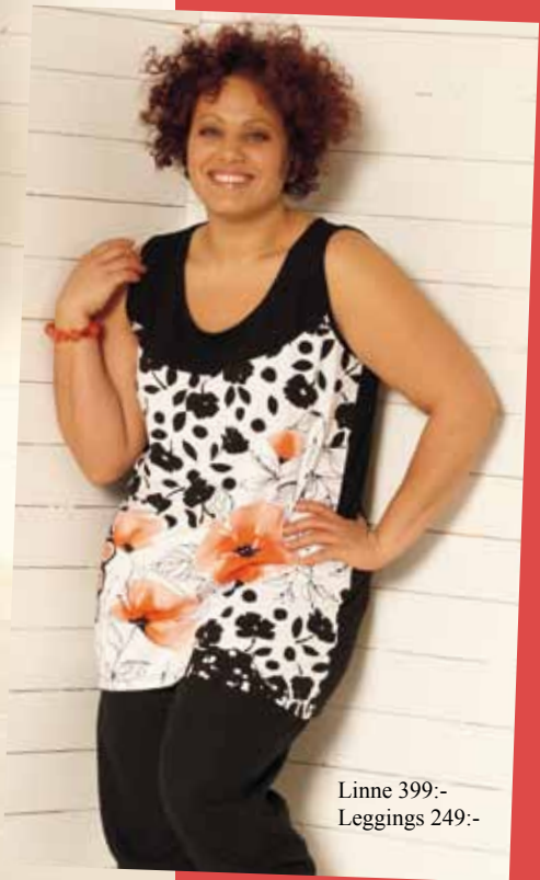
Linne 399:- Leggings 249:-