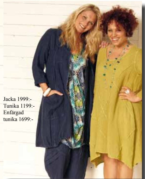
Jacka 1999:- Tunika 1199:- Enfärgad tunika 1699:-