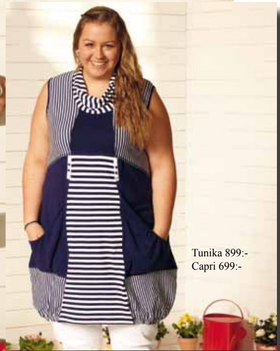
Tunika 899:- Capri 699:-