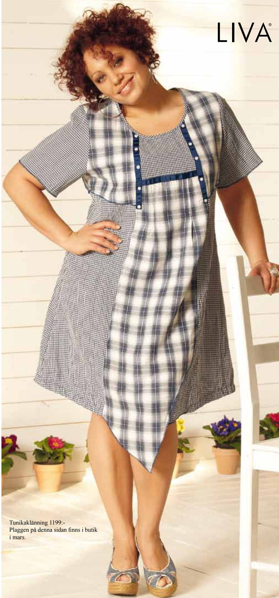
Tunikaklänning 1199:- Plaggen på denna sidan finns i butik i mars.