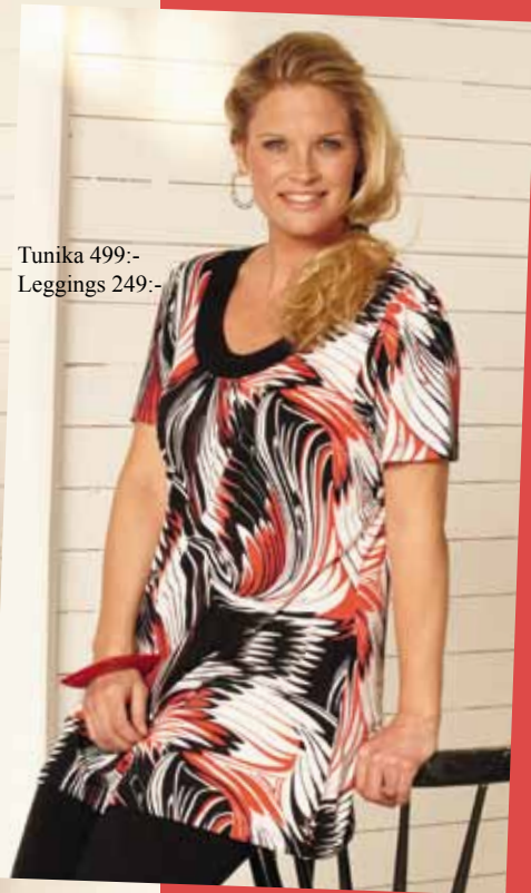
Tunika 499:- Leggings 249:-