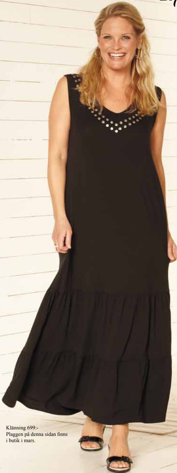
Klänning 699.- Plaggen på denna sidan finns i butik i mars.