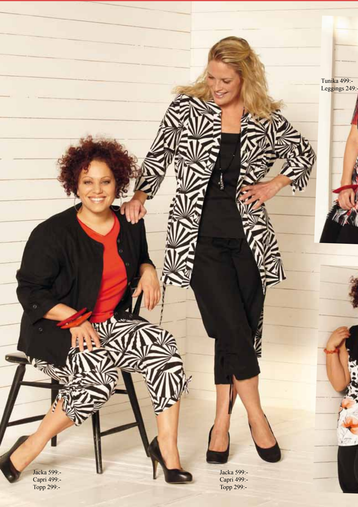
Jacka 599:- Capri 499:- Topp 299:-