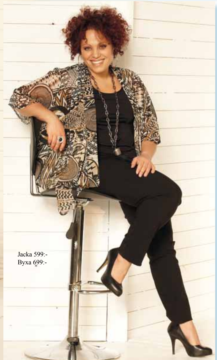
Jacka 599.- Byxa 699.-